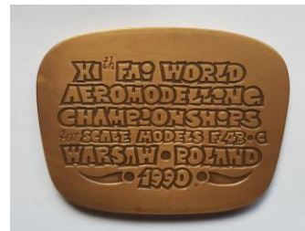
Logo oraz pamiątkowe medale 11. Mistrzostw Świata FAI Latających Makiet Samolotów – Warszawa 1990, Lotnisko Babice.